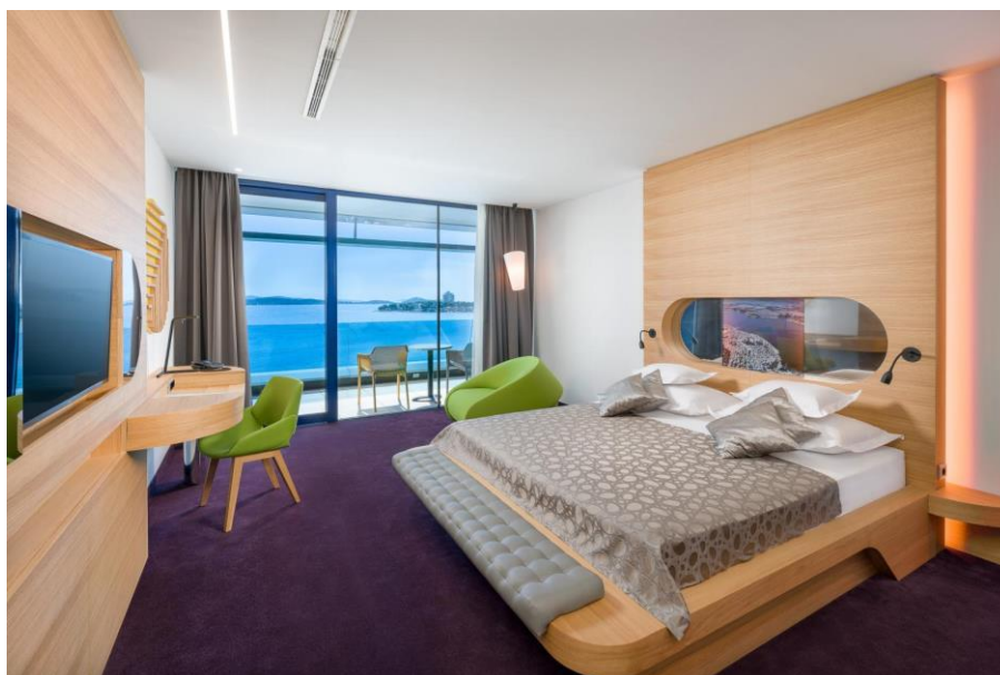
Sky Olympia 4*+